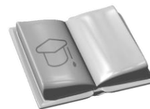
JAKOŚĆ EDUKACJI I KOMPETENCJI W REGIONIE