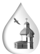
OCHRONA ŚRODOWISKA NATURALNEGO I DZIEDZICTWA KULTUROWEGO