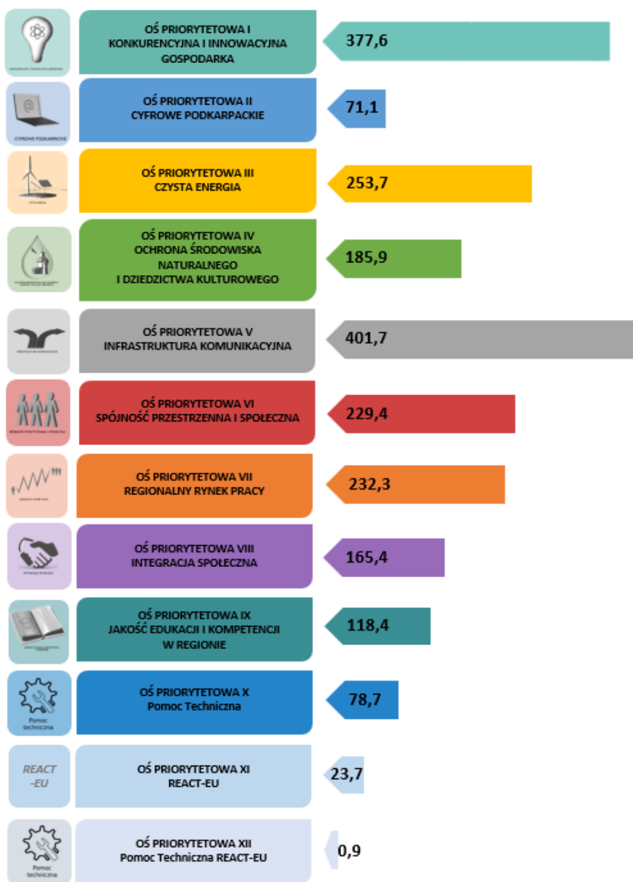
Rysunek 1. Podział alokacji w ramach RPO WP 2014-2020 (alokacja w mln EUR)

W pracach nad RPO WP 2014-2020 wykorzystano szereg wyników badań ewaluacyjnych wynikających z dotychczasowego dorobku ewaluacji z lat 2007-2013. Przede wszystkim w konstruowaniu szczegółowego zakresu interwencji przydatna była Ewaluacja ex-ante Regionalnego Programu Operacyjnego Województwa Podkarpackiego na lata 2014-2020 . W oparciu o wnioski z diagnozy wyzwań, potrzeb i potencjałów regionu ustalono, że realizacja celu głównego będzie wymagała wdrożenia dziesięciu osi priorytetowych.